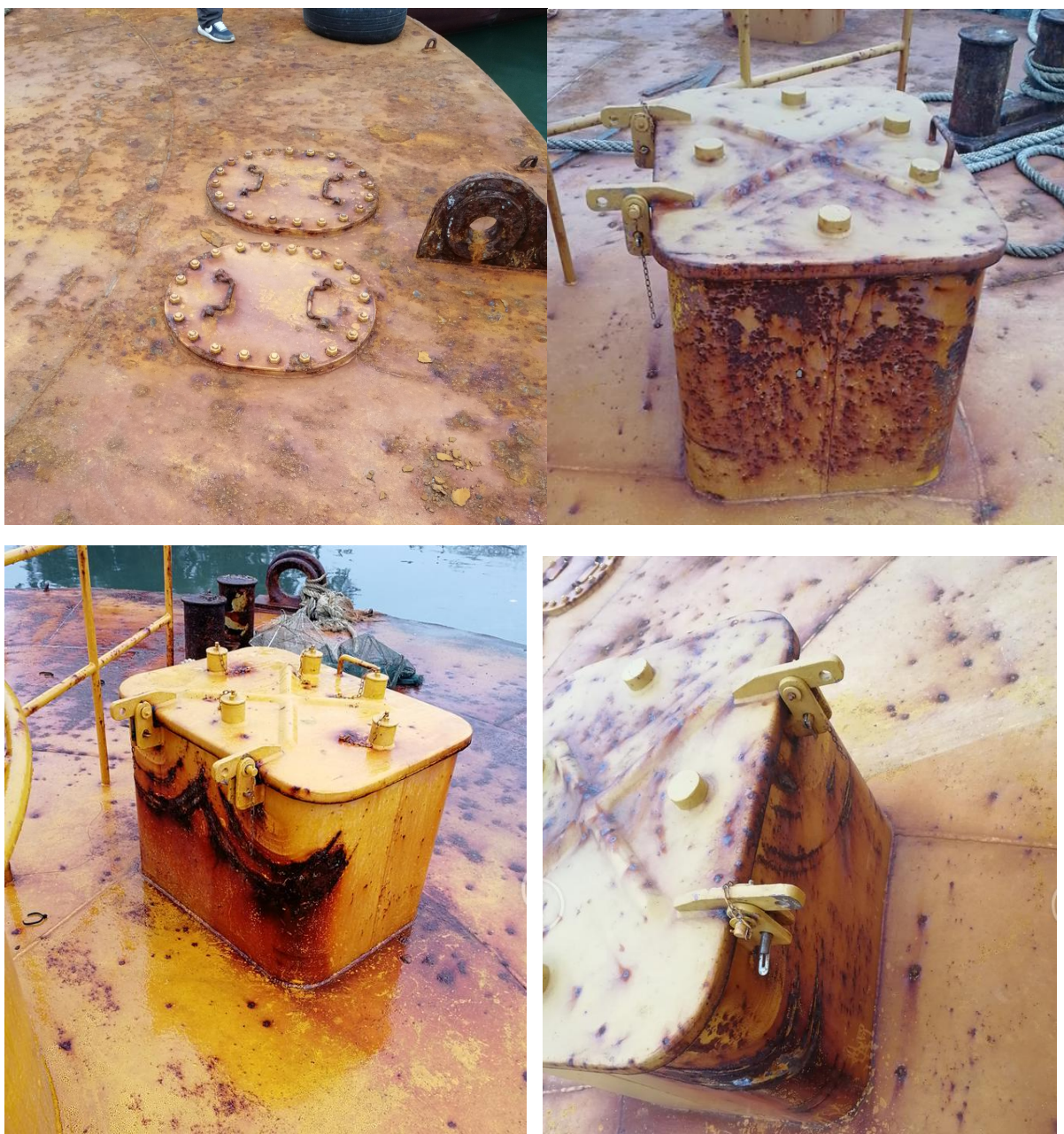
浮标桅杆风钩切掉。