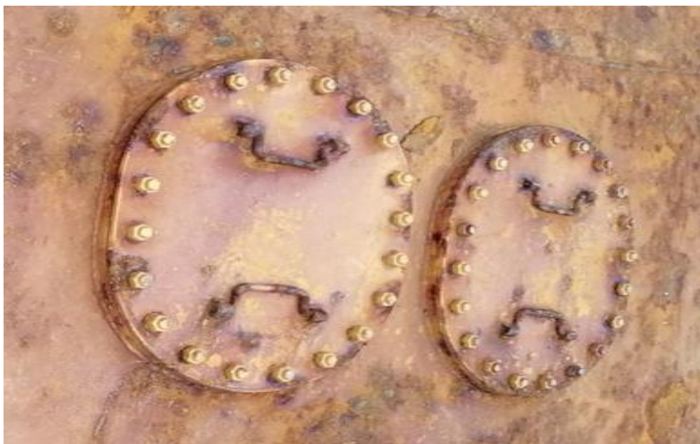
浮标水下仪器井异形轴锈蚀情况较轻，建议除锈、喷砂、刷漆处理即可。