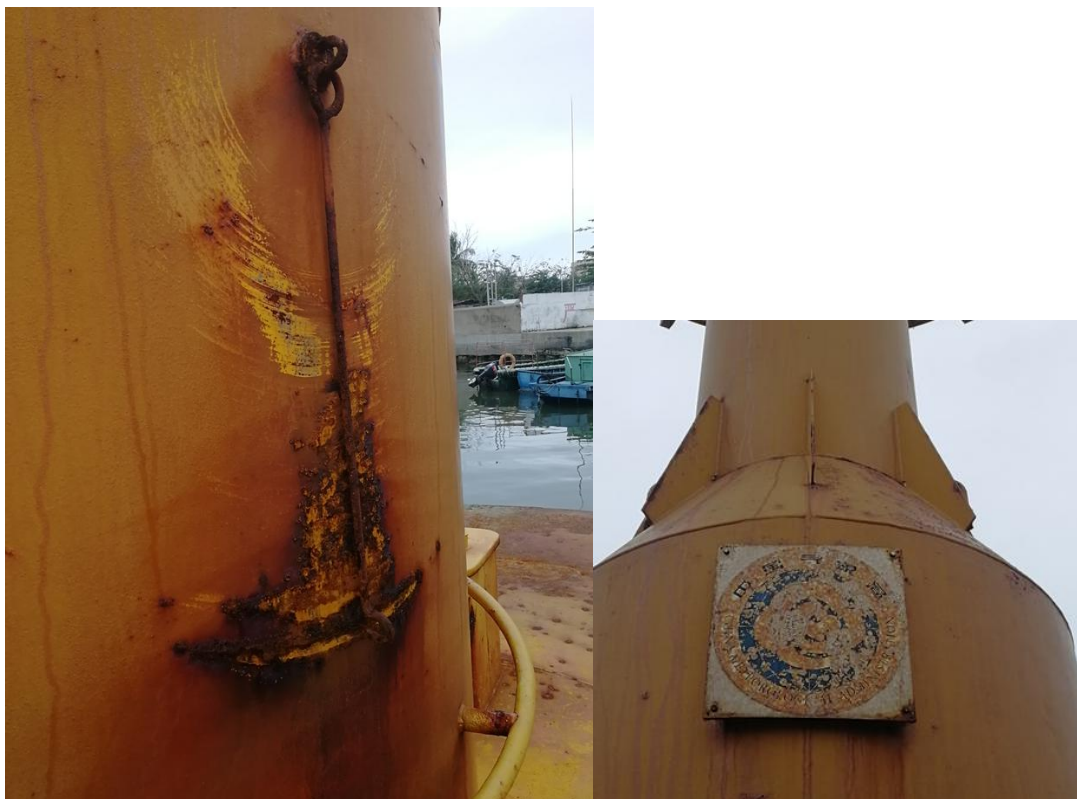
浮标体浮力舱需打开进行除锈， 重新安装后做打压试验。